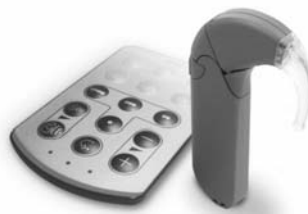
▲人工内耳 スピーチプロセッサ

補聴器を使ってもよく言葉が聞き取れない方は、人工内耳の装用によって改善する可能性がありますので、専門の医療機関でご相談ください。